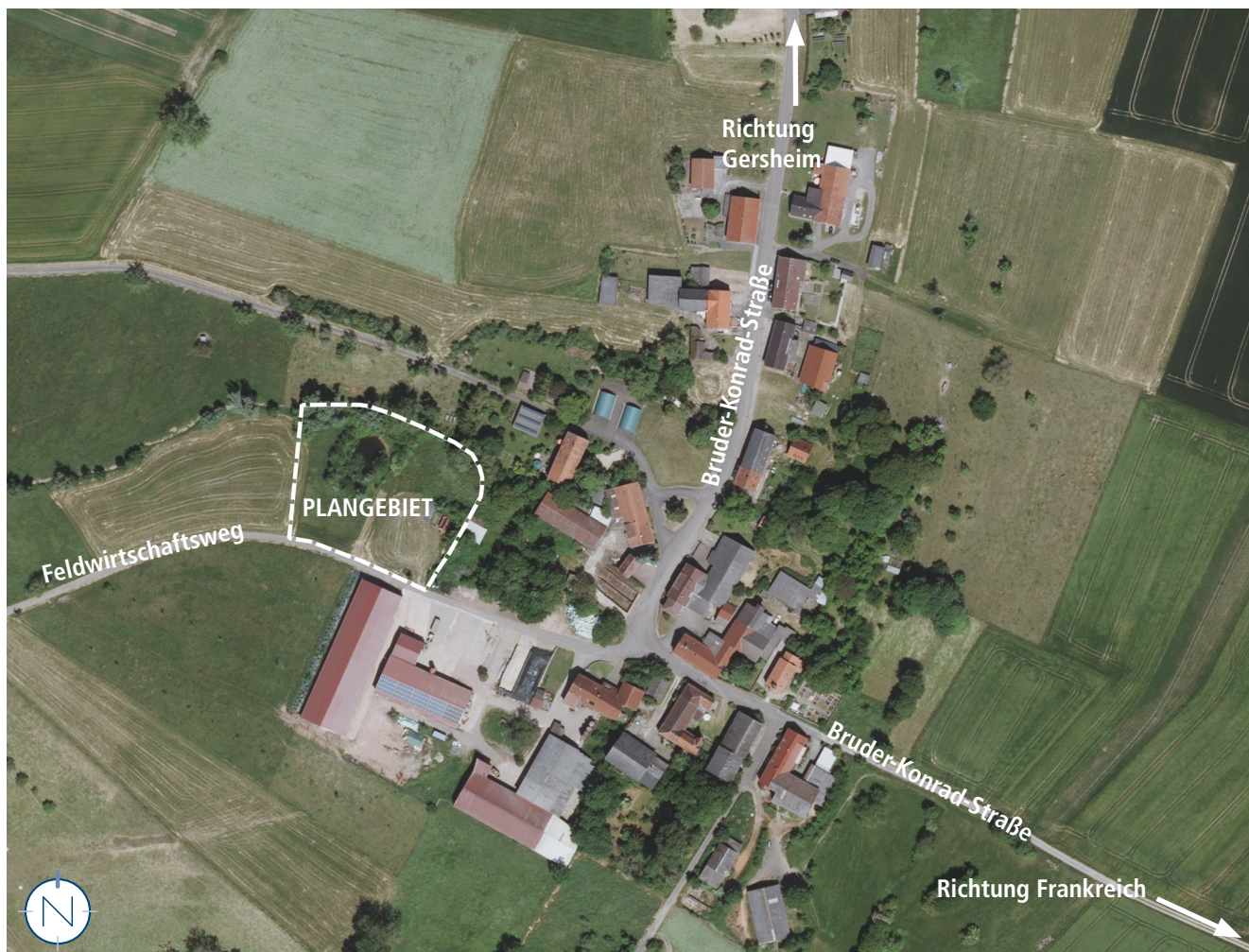
Luftbild mit Plangebiet; ohne Maßstab; ZORA, Z – 026/05, LVGL; Bearbeitung: Kernplan

Das Plangebiet fällt nach Westen nur leicht ab. Daher ist nicht davon auszugehen, dass sich die Topografie auf die Festsetzungen der Satzung auswirken wird.